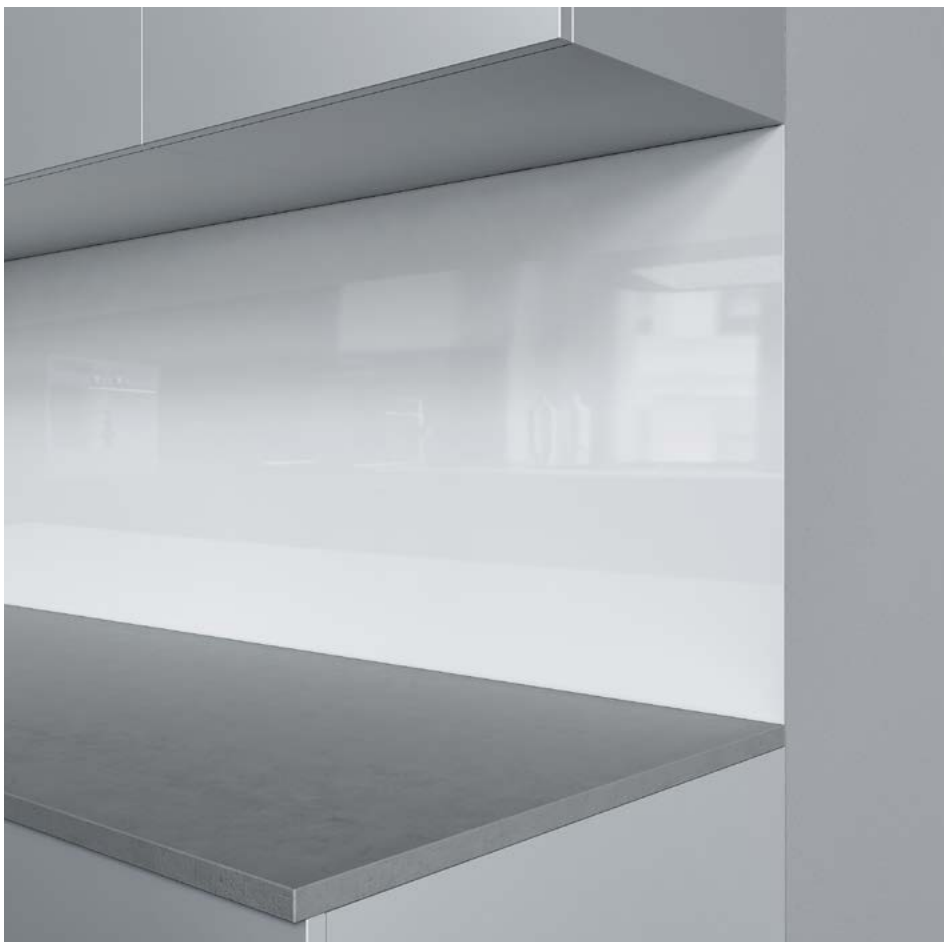
Schienale per cucine Schmidlin, opzione «bordo a vista»