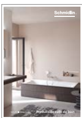
Catalogue de produits

Produits pour la salle de bains en acier titane-émailé: baignoires, receveurs et fonds de douche, lavabos, baignoires avec système Whirl