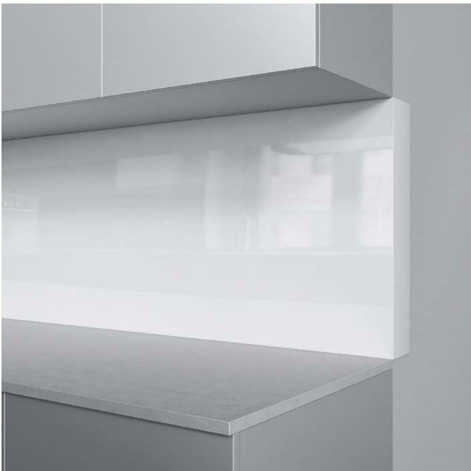
Entre-meuble de cuisine de Schmidlin, option «bord incurvé»