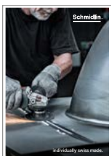
Catalogue de l'entreprise Schmidlin

(imprimés ou électroniques voir www.schmidlin.ch )